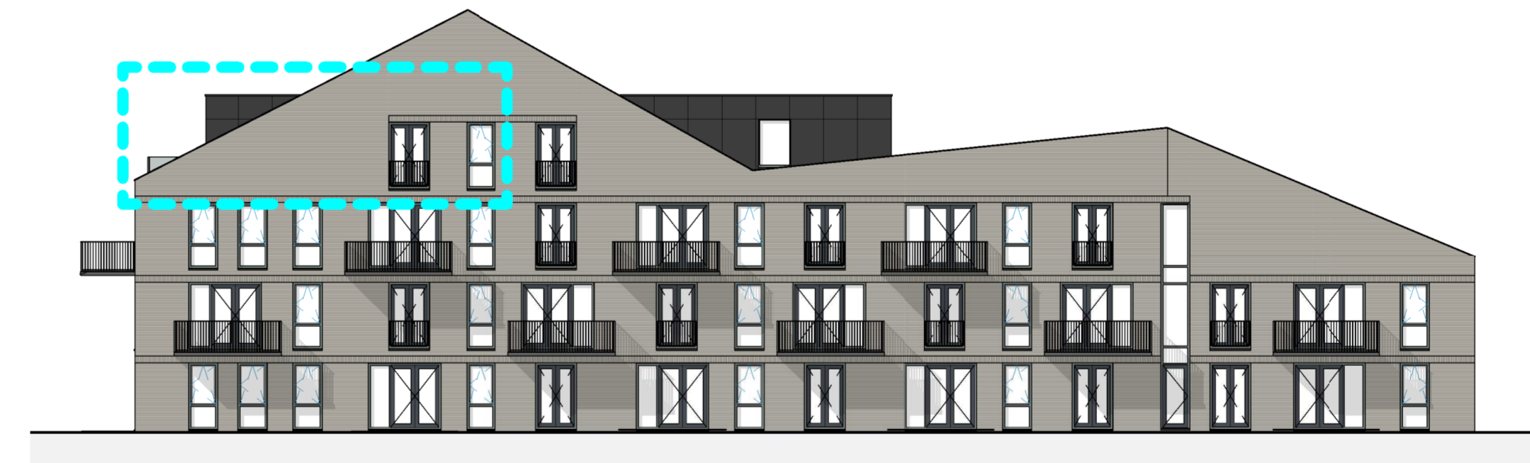
1:200 VOORGEVEL (ZUID)