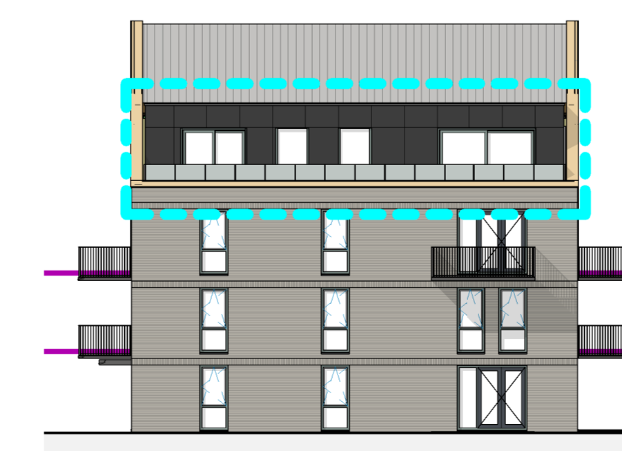
1:200 LINKERZIJGEVEL (WEST)

gewijzigd 07-02-2022 datum Kruidhof project nabij Pieter Repelaerstraat 51, Puttershoek, adresgegevens KBS Investment, opdrachtgever