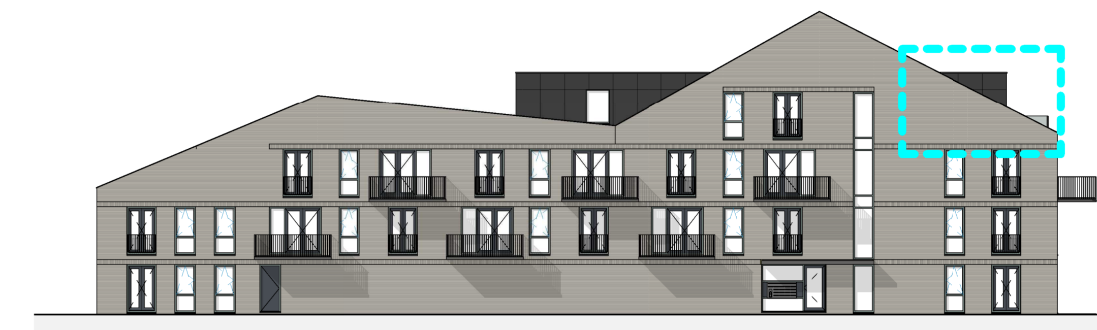
1:200 ACHTERGEVEL (NOORD)